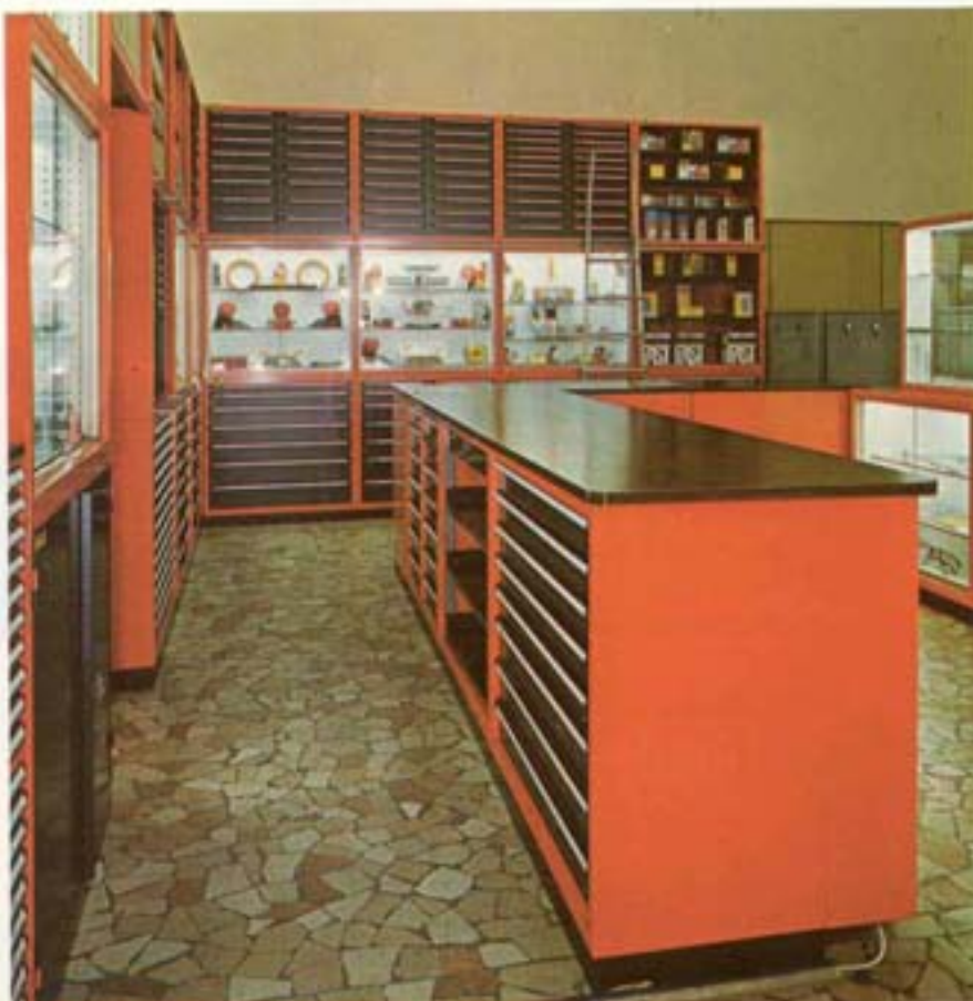
Utenspi - Utensileria Pistoiese di A. Melani - Pistoia Utensili, articoli tecnici, rappresentanza macchine utensili

Il problema della classificazione, archiviazione ed esposizione di centinaia di materiali eterogenei, ma soprattutto il problema di un loro rapido reperimento e la localizzazione in vicinanza dei punti di vendita è stato risolto dalla S.U.S.T.A con la creazione delle sue "Pareti attrezzate", veri e propri depositi polmone fra il banco e il magazzino vero e proprio. Il sistema è stato studiato prevedendo infinite possibilità di adattamento allo spazio esistente e alle necessità operative dei singoli commercianti. Le "pareti attrezzate" sono quindi altrettanti magazzini, con in più il vantaggio di sfruttare molto meglio ogni centimetro quadrato di superficie e contemporaneamente di migliorare l'estetica del negozio e la funzionalità operativa del personale.